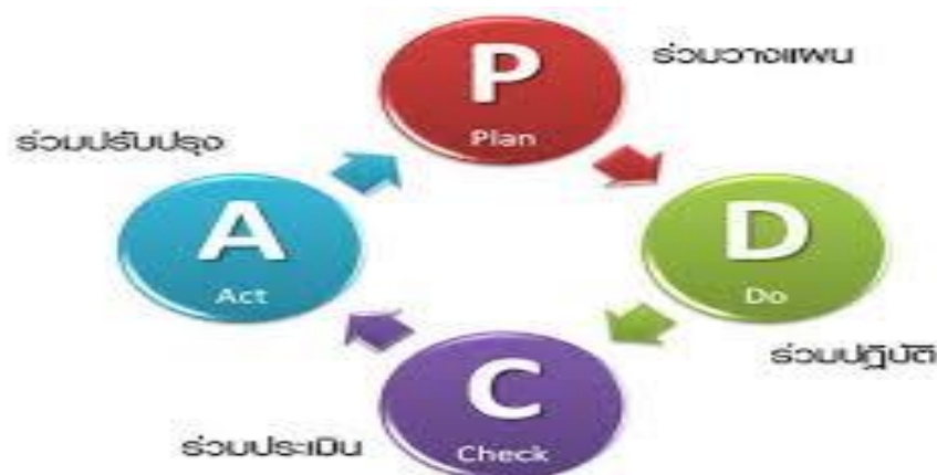
ภาพที่ ๑ วงจร PDCA

วงจร PDCA ที่สมบูรณ์จะเกิดขึ้นเมื่อนำผลที่ได้จากขั้นตอนการดำเนินการที่เหมาะสม (Act) มาดำเนินการให้เหมาะสมในกระบวนการวางแผนอีกครั้งหนึ่ง (Plan) และเป็นวงจรอย่างนี้เรื่อย ๆ ไม่มีที่สิ้นสุด จนกระทั่งเราสามารถนำวงจรนี้กับทุกกิจกรรมที่คล้ายกันได้อย่างเป็นปกติไม่ยุ่งยากอีกต่อไป จะเห็นว่าวงจร PDCA จะไม่ได้หยุดหรือจบลงเมื่อหมุนครบรอบแต่จะลู่ PDCA จะหมุนไปข้างหน้าเรื่อยๆ โดยจะทำงานในการแก้ไขปัญหาในระดับที่สูงขึ้น ซ้ำซ้อนขึ้นและยากขึ้น หรือเป็นการเรียนรู้ที่ไม่สิ้นสุด ซึ่งสอดคล้องกับปรัชญาของการพัฒนาอย่างต่อเนื่อง (Continuous Improvement) อย่างไรก็ตามหัวใจสำคัญของวงจร Deming ไม่ได้ขึ้น อยู่กับ PDCA เท่านั้น แต่อยู่ที่คนที่มีคุณภาพและเข้าใจคุณภาพอย่างแท้จริง