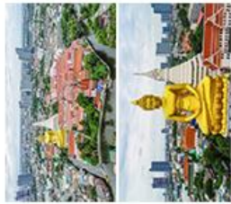
วัดปากน้ำภาษีเจริญ