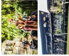
บ้านศิลปิน