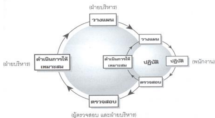
รูปที่ ๕.๑ วงจรคุณภาพ PDCA

๔. A (Action) ขั้นตอนการดำเนินงานให้เหมาะสม จะพิจารณาผลที่ได้จากการตรวจสอบ ซึ่งมีอยู่ ๒ กรณี คือ ผลที่เกิดขึ้นเป็นไปตามแผนที่วางไว้ หรือไม่เป็นไปตามแผนที่วางไว้ หากเป็นกรณีแรกให้นำแนวทางหรือกระบวนการปฏิบัตินั้นมาจัดทำเป็นมาตรฐาน พร้อมทั้งหาวิธีการที่จะปรับปรุงให้ดียิ่งขึ้นไปอีก ซึ่งอาจหมายถึงสามารถบรรลุเป้าหมายได้เร็วกว่าเดิม หรือเสียค่าใช้จ่ายน้อยกว่าเดิม หรือทำให้คุณภาพดียิ่งขึ้นก็ได้ แต่ถ้าหากเป็นกรณีที่สอง คือ ผลที่ได้ไม่บรรลุวัตถุประสงค์ตามแผนที่วางไว้ ควรนำข้อมูลที่รวบรวมไว้มาวิเคราะห์และพิจารณาว่าควรจะดำเนินการอย่างไร เช่น มองหาทางเลือกใหม่ที่ น่าจะเป็นไปได้ ใช้ความพยายามให้มากขึ้นกว่าเดิม ขอความช่วยเหลือจากผู้รู้ หรือเปลี่ยนเป้าหมายใหม่