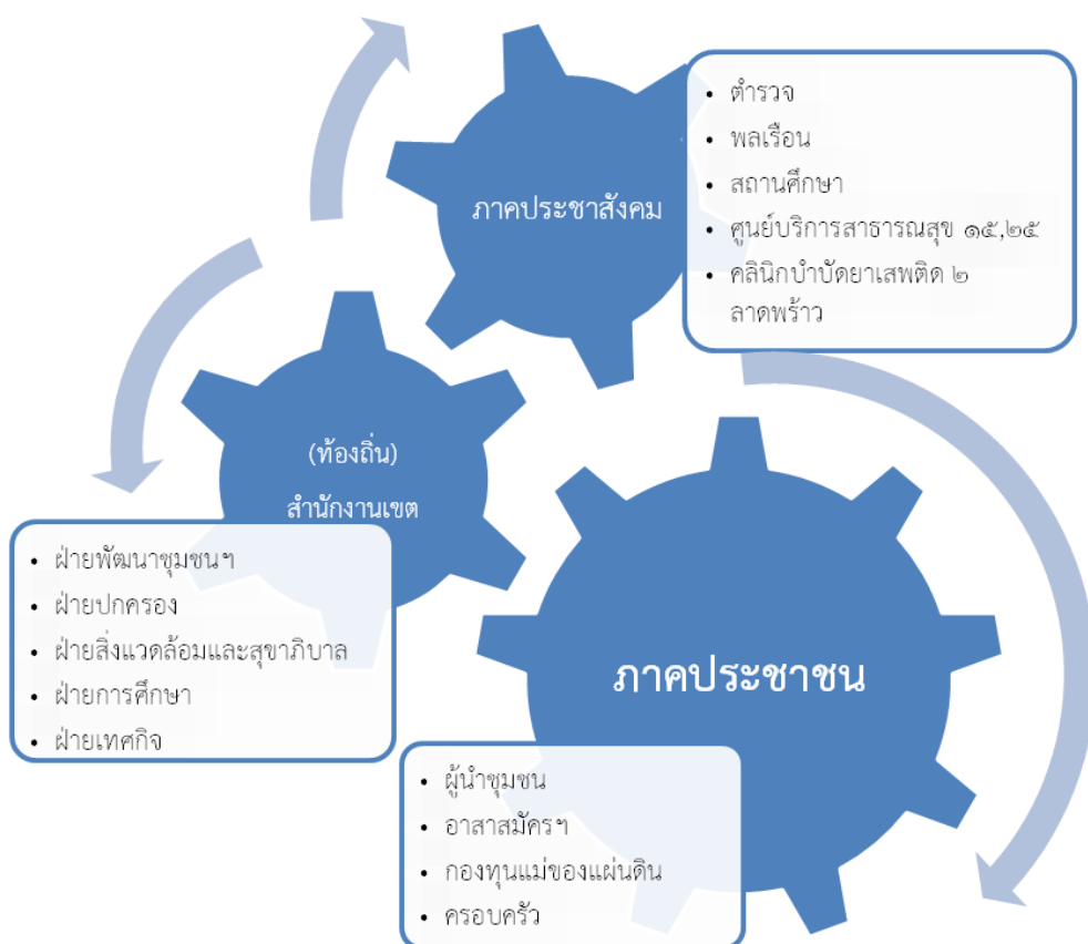
แผนภาพโครงสร้างภาคีเครือข่ายการป้องกันและแก้ไขปัญหาเสพติดของชุมชนลาดพร้าว ๔๕ เขตห้วยขวาง