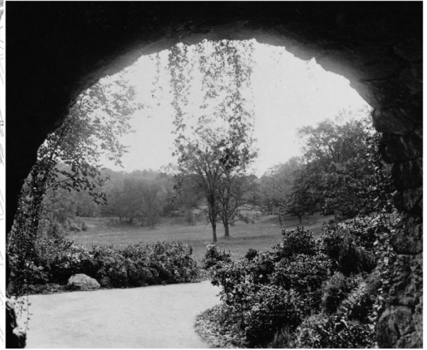
Circulation System of Prospect Park, Brooklyn, New York